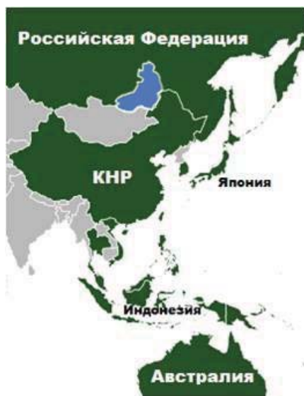
Рис. 1. Азиатско-тихоокеанский регион

зисное десятилетие (т.е. «использовать чужой паровоз, покуда свой не везет»).