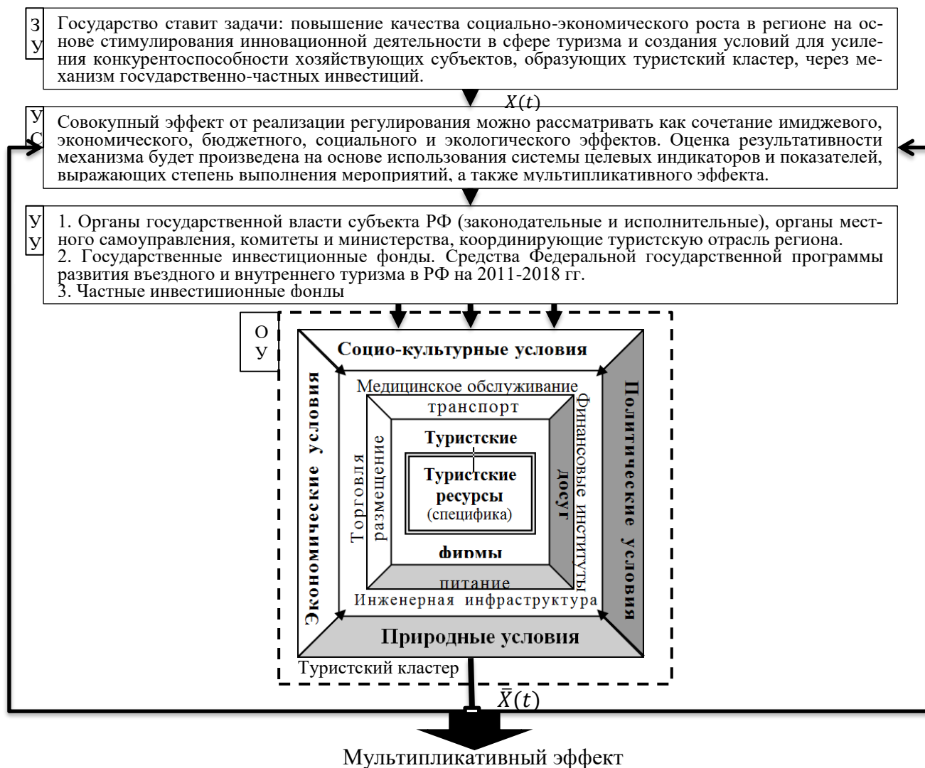
Рис.2. Структурная схема системы управления туристской отраслью региона

На рисунке 2 представлена структурная схема управления туристской отраслью региона.